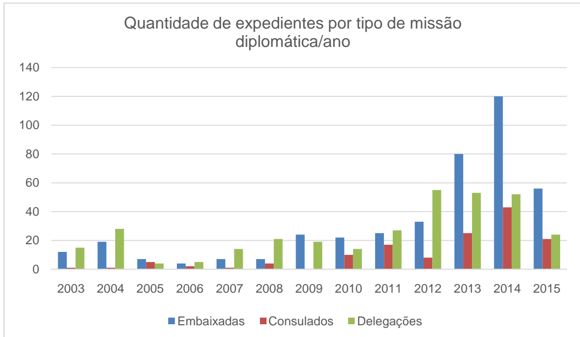
Figura 2: Distribuição por tipo de missão diplomática dos expedientes telegráficos enviados e recebidos pelo Ministério das Relações Exteriores, com algum tipo de menção à temática LGBT ao longo do período de 2003 a 2015.

A pesquisa constatou, que o tema LGBT foi mais abordado pelos postos diplomáticos na Europa (392 documentos) e na América do Norte (212 documentos) do que seus homólogos na África (44 documentos), América Latina (145 documentos) e Ásia, Oriente Médio e Oceania (92 documentos) 38 . Isso revela que o assunto é tipicamente ocidental, sendo estranho à agenda de países orientais.