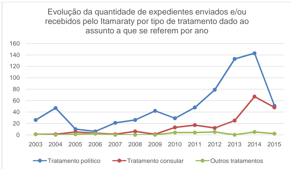
Figura 3: Evolução da forma com que o tema LGBT veio sendo tratado nas comunicações telegráficas do Itamaraty entre 2003 e 2015.

O comparativo entre os totais contabilizados em cada tipo de abordagem, demonstra uma inflexão na direção de um ganho de importância da abordagem consular, após a publicação do Decreto 7.214 39 . Embora nos dois períodos a maioria absoluta dos documentos tenha tratado a temática LGBT, como uma questão de natureza política, percebe-se que, após 2010, esta forma de tratamento começa a perder importância relativa, diante de uma ascensão mais acentuada do tratamento consular.